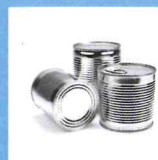
CONTENITORI (CARNE, CONSERVE, ECC)

Gli imballaggi in acciaio (barattoli, scatolette, latte, lattine, tappi, capsule, fusti e bombolette spray) sono riciclabili al 100% e all'infinito. Basta separarli accuratamente attraverso la raccolta differenziata. Un semplice gesto quotidiano che consente il loro recupero, affinché possano tornare ad essere nuova materia prima: Acciaio.