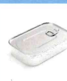
CONTENITORI PRODOTTI ITTICI