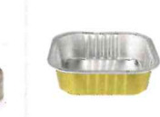
CONTENITORE CIBO PER CANI